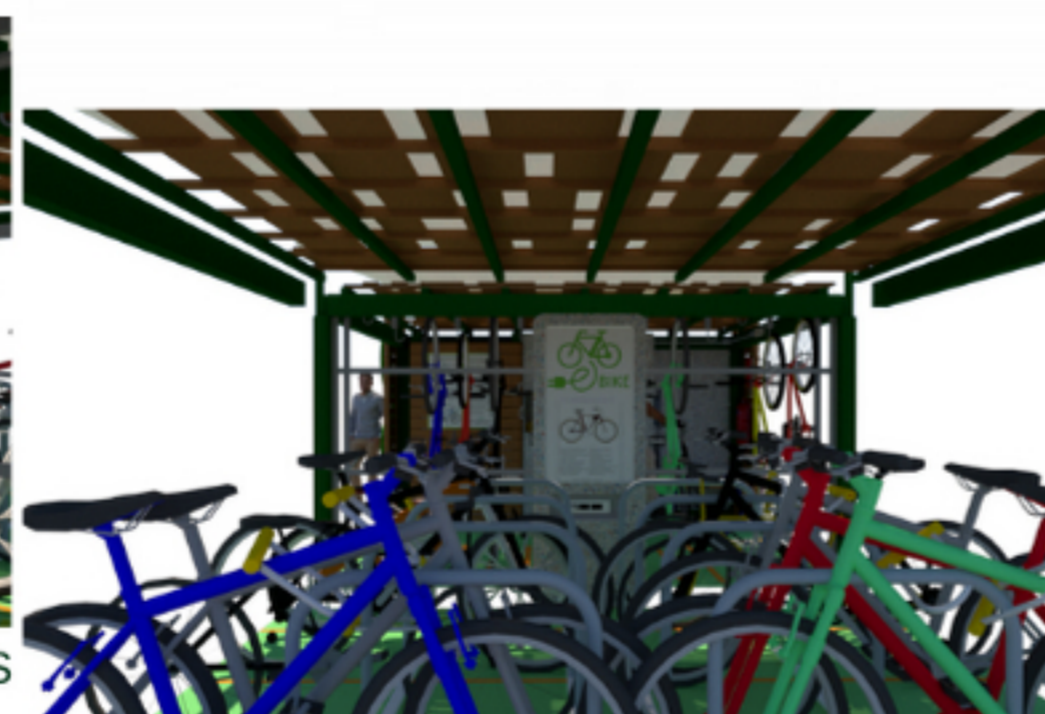
VISTA BICICLETAS HORIZONTAIS