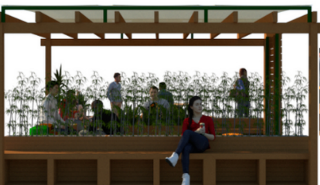
VISTA LATERAL ESQUERDA