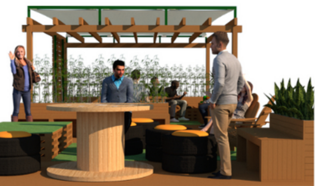
VISTA LATERAL DIREITA

Composto para implantação tanto em áreas com cobertura pré existente quanto descobertas, o espaço possui mobiliário ecológico de madeira plástica, mesa de carretel de madeira e bancos de pneus reaproveitados. A disposição variada favorece diferentes usos através de áreas distintas, sendo basicamente estas, compostas por um espaço para acomodação mais descontraída em platôs mais amplos, bancos ripados, uma mesa de apoio e puffs de pneu. Para separação sucinta dos ambientes, utilizou-se jardineiras confeccionadas também com madeira plástica, onde foram acomodadas plantas das espécies bambu ornamental, dracena e espada larga.