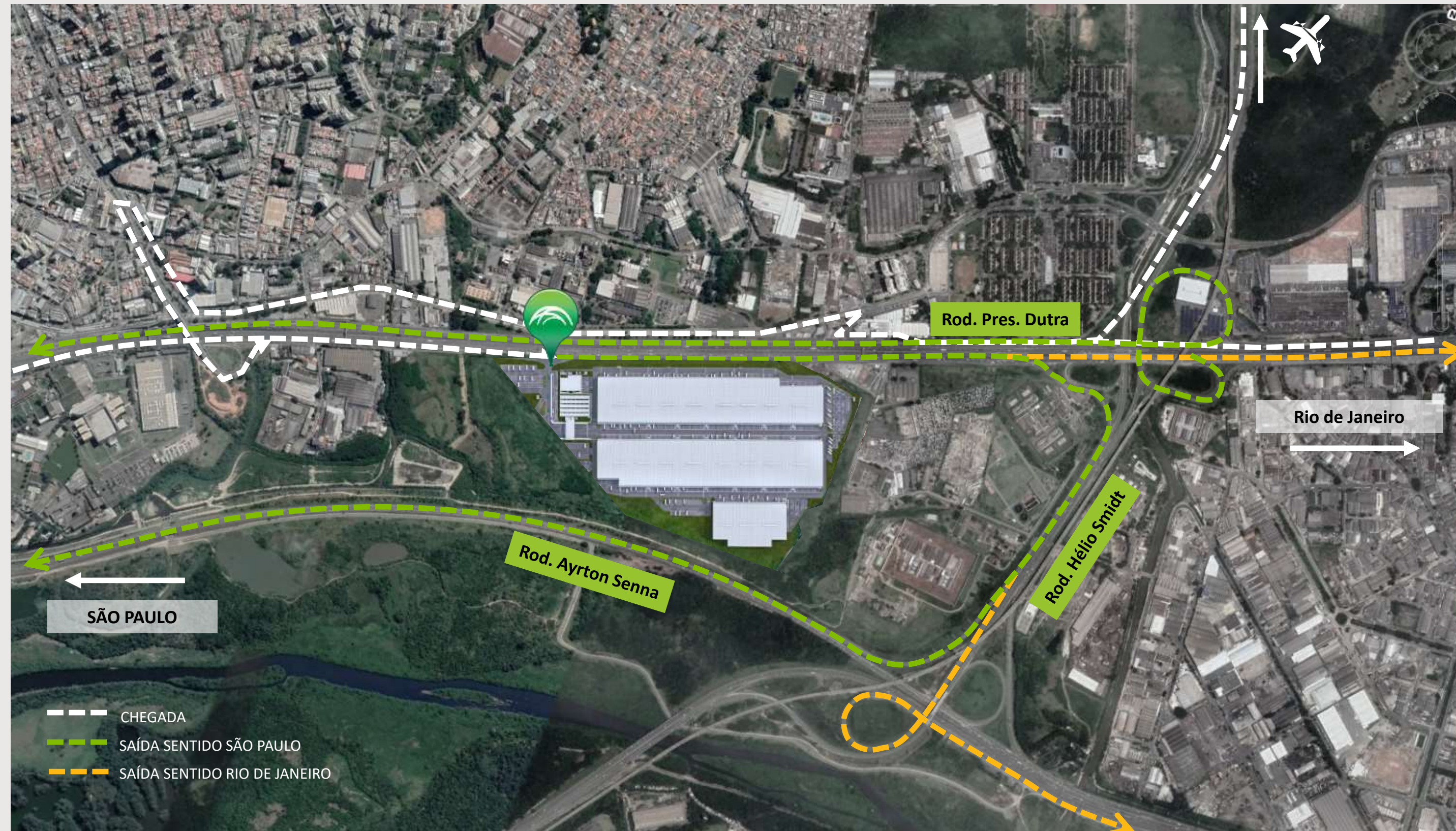
Acesso pela Rodovia Dutra, entre o km 218 e km 219